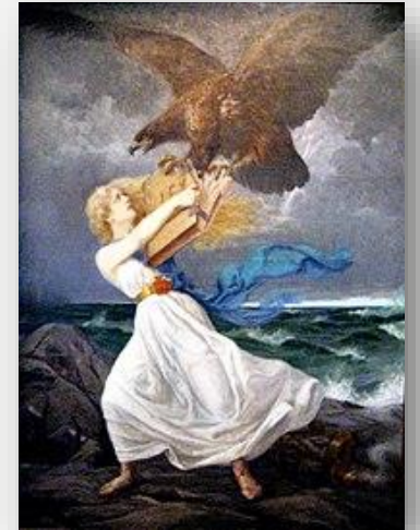
Eetu Iston teos Hyökkäys (1899) jossa "Venäjän kotka ahdistaa Suomi-neitoa"

Nikolaj Ivanovitj Bobrikov Suomen kenraalikuvernööri